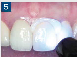
5. 余剰セメントから2-3cm離して、1-2秒光照射を行います。