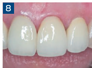
8. 余剰セメント除去後です。