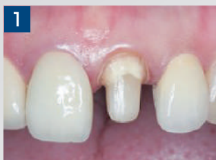
1. 歯面に残った仮着材や汚れを除去し、水洗後、軽くエアード乾燥します。