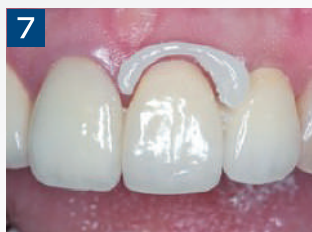
7. 余剰セメントが一塊で除去できました。