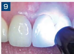
9. 各面に光照射を行います。