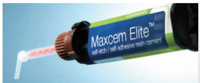
表1 マックスセム エリートの接着力

本セメントは、テクニカルガイドを熟読し、ガイドに準じて使用することで長所を最大限生かし、臨床的に有用なセメントとして用いることができると思います。