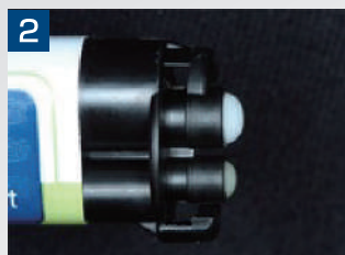
2. ミキシングチップを装着する前に、均等に出る事を確認します。