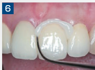
6. 余剰セメントを探针など用いて、一塊に除去します。