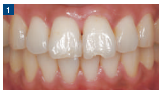
1 術前。転倒し、前歯を破折したとのことで来院。