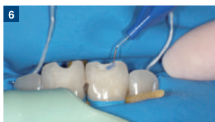
6 エナメル質にセレクトイブエッチングを施す。