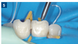
5 接着面にサンドブラスト処理を行う。