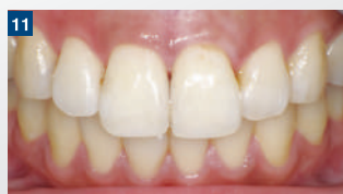
11 形態修正、研磨後。十分な患者さんの満足を得ることができた。