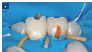
7 隣接面の隔壁には、アダプトセクショナルマトリックスを使用。