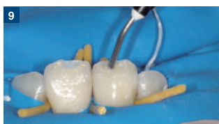
9 積層充填を行うが、気泡混入に注意する。