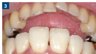
3 後日、改めて時間をとり、隣接面カリエスと同時に治療することになった。