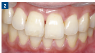
2 応急処置として、フロアブルレジンにて修復。