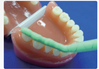
従来品(ミキシングチップL)

シリコンバイトチップを用いて、薄い板状に注出されたテイク1 アドバンス バイトは従来の約1/2の量で同等の咬合印象採得が行えます。