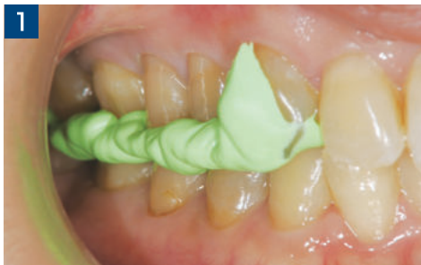
1 テイク1 アドバンス バイトを用いた口頭嵌合位での咬合採得。咬合時の抵抗はない。

歯冠修復材料には生体への治癒能力は働かないため、その精度が臨床での予後を大きく左右すると考える。テイク1 アドバンス バイトはその高い精度により、良好な予後を期待できる使いやすい材料である。