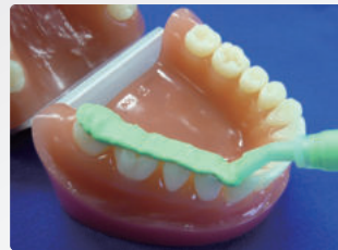
シリコンバイトチップ