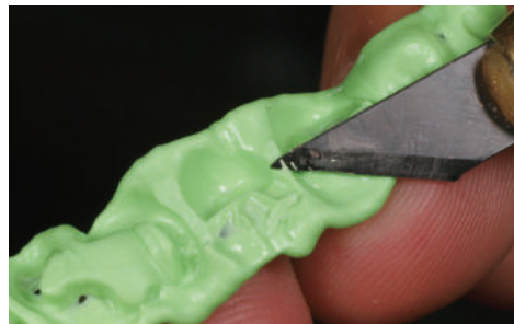
咬合面裂溝やアンダーカット部のトリミング。適度な硬度があり、容易に行うことができる。