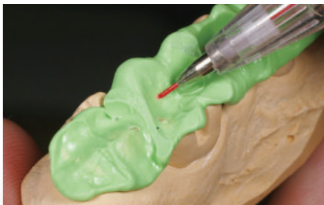
模型への咬合接触点の印記。