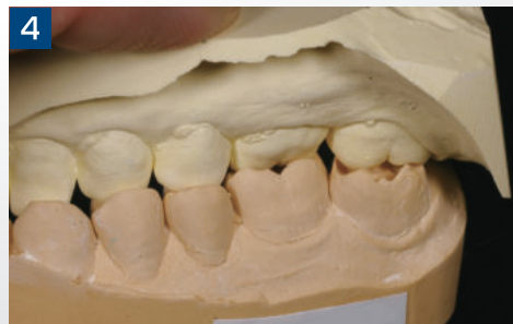
4 テイク1 アドバンス バイトにより、正確にマウントされた上下顎石膏模型。高い精度により、良好な予後を期待できる。