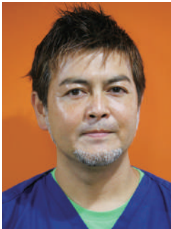
神奈川県 ざくろ歯科