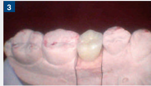
補綴物の準備。今回はCAD/CAM冠を装着する。