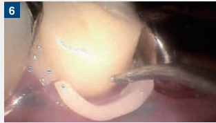
1~2秒のタックキュアにより余剰セメントはゲル化。探針で簡単に除去できる。