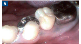
術後の経過も良好である。