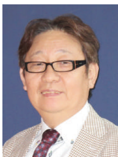
愛知県 山下歯科医院