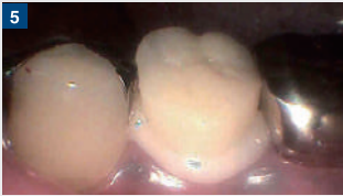
補綴物のセット。全周より溢れるように十分なセメントを使用する。