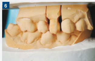
6 咬合器にマウントされた上下顎石膏模型：テイク1 アドバンス バイトにより得られた正確な情報が上下顎模型の位置関係に反映されている。