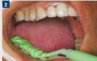
2 シリコンバイトチップを用いて薄い板状に抽出されたテイク1 アドバンス バイト。従来の約1/2の量で同等の咬合印象採得が行える。