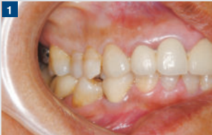
1 上顎右側第一小臼歯のインレー新製希望で来院。インレー窩洞形成後の口腔内写真。