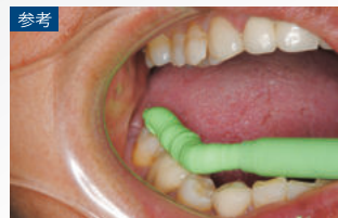
参考 従来のミキシングチップ(ミキシングチップ)を用いて抽出されたテイク1アドバンス：シリコンバイトチップを使用して抽出したもの(図2)と比較して厚みがあることが確認できる。