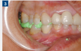
3 咬頭嵌合位での咬合採得：硬化時間が短い ため、咬合時のズレの発生を抑えることができる。