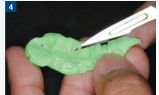
4 余剰部のトリミング：硬度が高いため変形することなく、容易にトリミングを行うことができる。