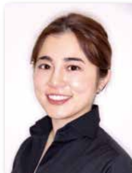
こうざと矯正歯科クリニック 歯科衛生士

1997年 愛知学院大学歯学部歯学科卒 愛知学院大学歯学部歯科矯正学講座入局 2003年 愛知学院大学大学院歯学研究科修了 こうざと歯科・矯正歯科クリニック勤務 2005年 Harvard University Special Residency Course 修了 (Boston MA USA) Roth/Williams Philosophy Course 修了 2009年 こうざと矯正歯科クリニック院長