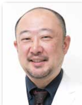
こうざと矯正歯科クリニック院長

こうざと矯正歯科クリニック 〒762-0032 香川県坂出市駒止町1-4-2 http://www.kouzatokyousei.com/