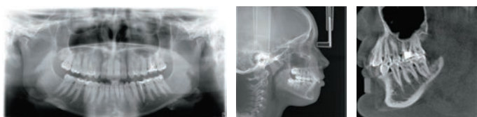
販売名:カボOP 3D 医療機器認証番号:229AIBZX00037000