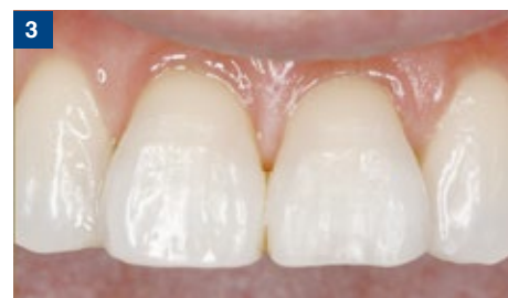
3 コンポジットレジン充填後。