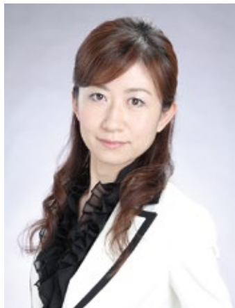
ナカ工歯科クリニック院長 (神奈川県)