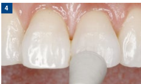
4 オブチワンステップ ポリッシャーによる中研磨と艶出し。