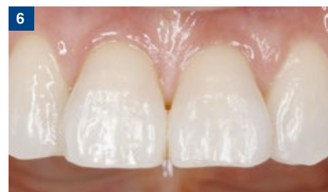
6 カーのシステムチックな研磨システムにより、滑沢な研磨面が短時間で得られた。