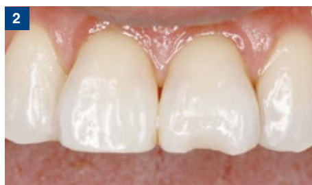
2 エッチング材水洗後。短時間で確実な水洗をすることができる。エッチング材の色調が紫色のため、視覚的にエッチング材の洗い残し(エッチング材の残留)を確認することができる。