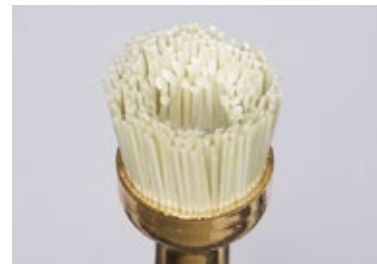
図3) 研磨粒子が配合されたブラシが中心に向かって短く植立されている

オブチシャインはオブチワンステップ ポリッシャーと併用することで、コンポジットレジンの光沢感や滑沢感を比較的短時間に得ることができる。と考える。